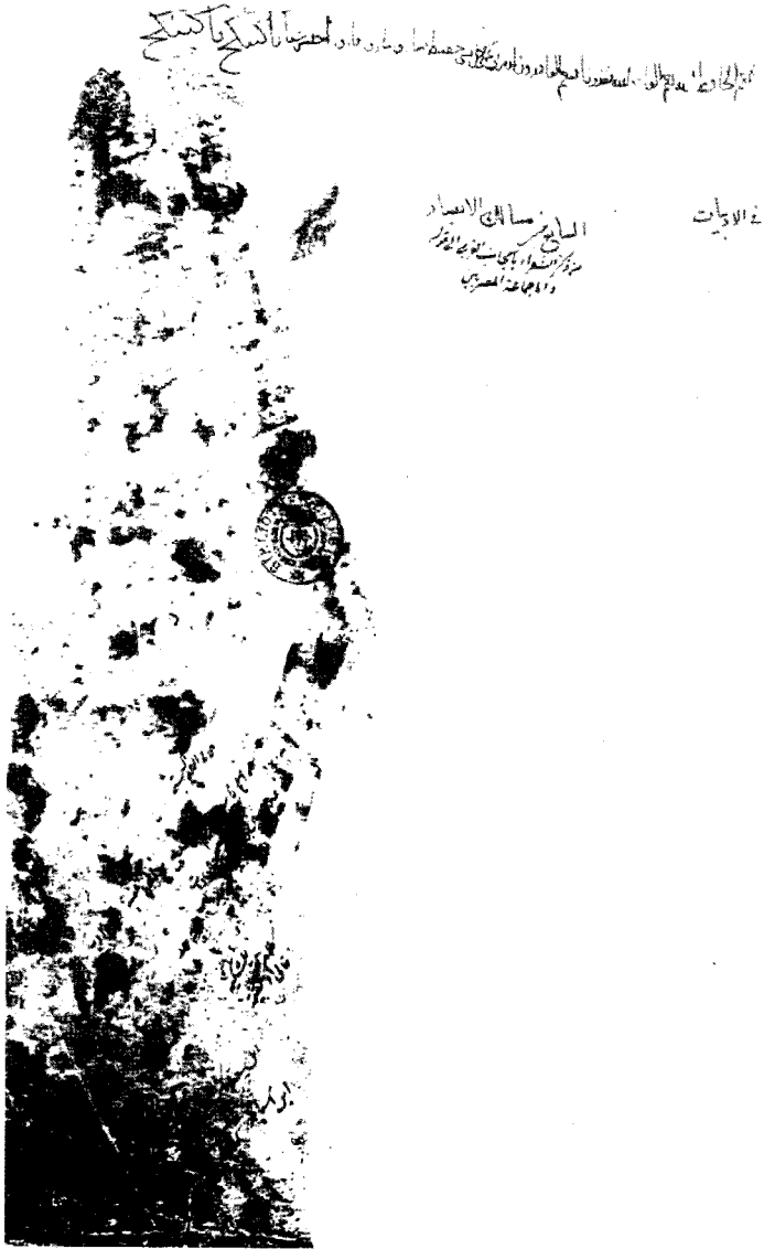
صفحة العنوان - مخطوطة المكتبة الوطنية - باريس رقم ٢٣٢٧